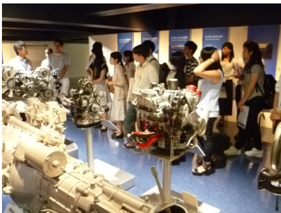
【マツダミュージアム見学】