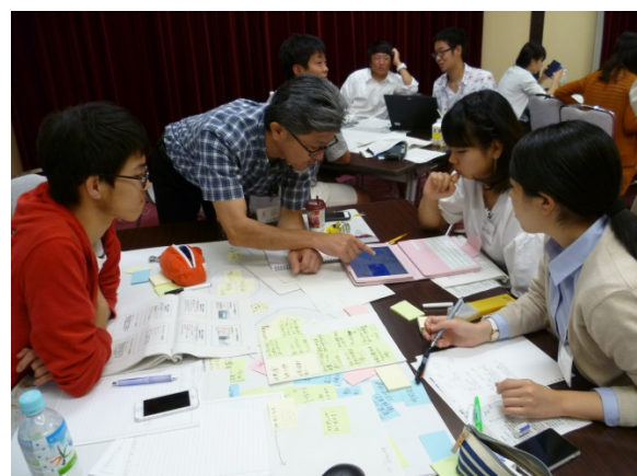
【グループワークの様子】